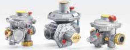
ÇİFT KADEMELİ SERVİS REGÜLATÖRLERİ