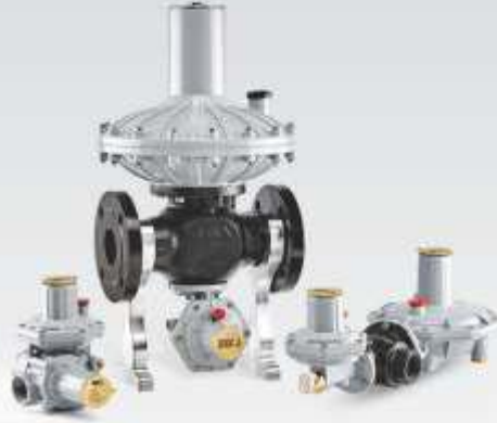
DİREKT ETKİLİ GAZ BASINÇ REGÜLATÖRLERİ