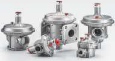
TEK KADEMELİ GAZ BASINÇ REGÜLATÖRLERİ