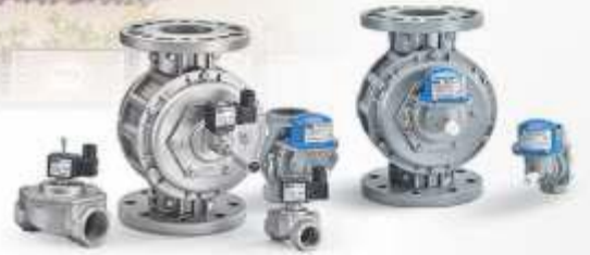
GAZ VALFİ VE DEPREM VANALARI